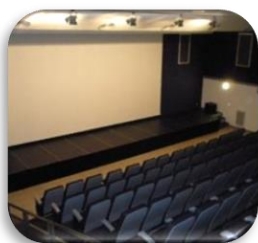
Espace Culturel Le Matavo - CABASSE

J'autorise l'association LVELA e.s.a à publier sur divers supports (numériques ou non) liés à la promotion et diffusion de son activité culturelle , les photographies et vidéos à mon égard, prises lors du stage (pendant les cours et au moment des concerts) : Site, Facebook, Affiches, Instagram ... OUI - NON